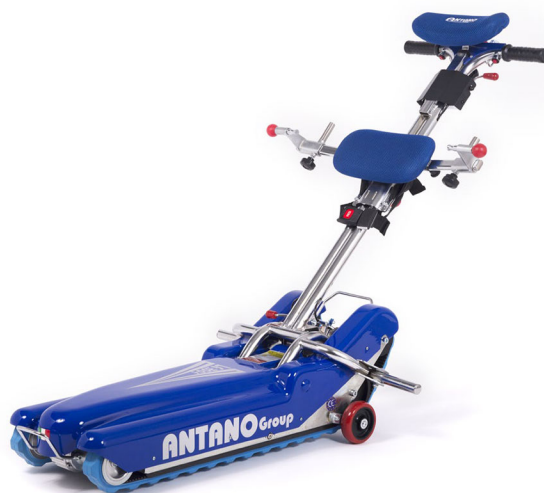
Trepironija LG 2004

Tehnoloogiline innovatsioon, lähenemine patsiendile ja tähelepanu esteetilistele detailidele on teinud LG2004 trepironija aastate jooksul nii edukaks. Täna pakub uus versioon kõiki omadusi, mis on välja töötatud kaheksa aasta jooksul.